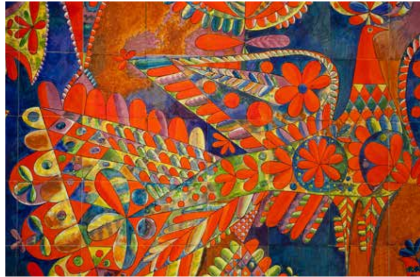
В.М. Городецкий Панно-триптих «Русский фриз». Фрагмент 1968