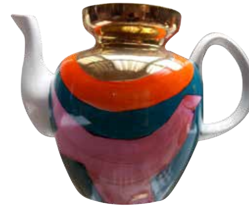
П.В. Леонов Элемент комплекта «Кованый» 1972 Элемент комплекта «Баллада о солнце» 1980

Отметь галочкой элементы, встречающиеся на панно