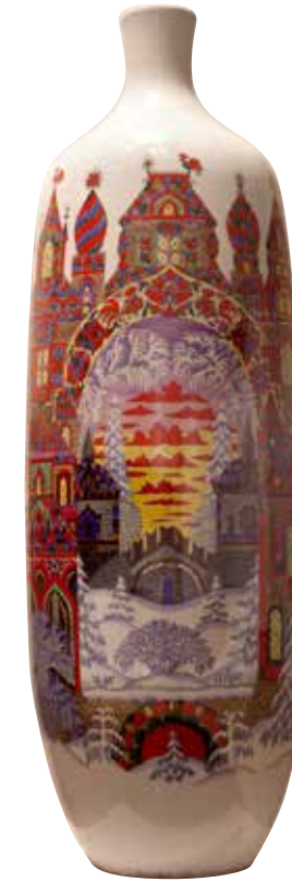
А.В. Воробьевский, А.А. Лепорская Ваза «Русская зима» 1967

Какими красками художник раскрасил птицу? Проведи линии