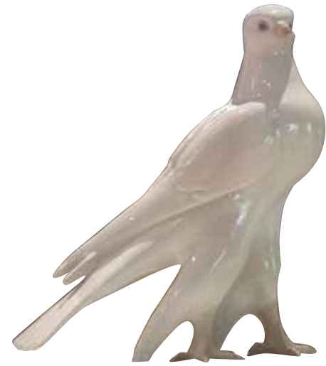
А.Г. Сотников Скульптура «Сокол» 1957