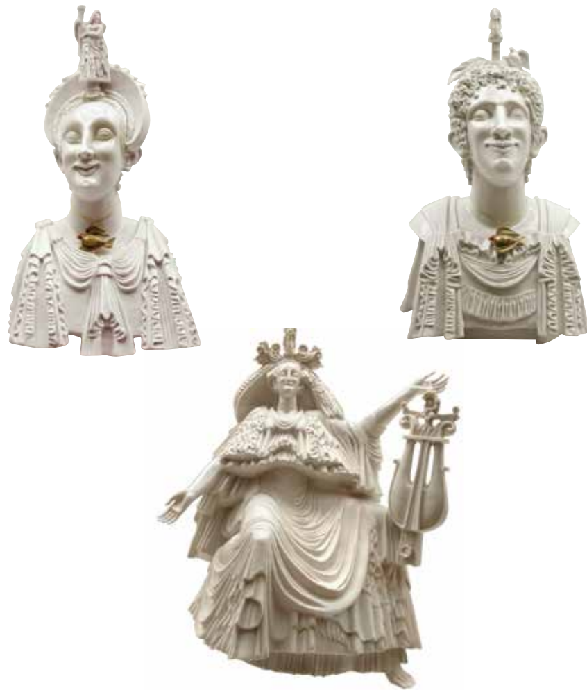
И.С. Олевская Элементы декоративной композиции «Этюд к сонету Ф. Петрарки «Благословен день, месяц, лето, час...» 1977

**Зимний период с 1 октября по 14 апреля